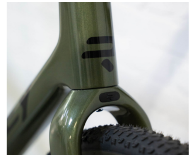
Kanzo Adventure en Army Green Metallic