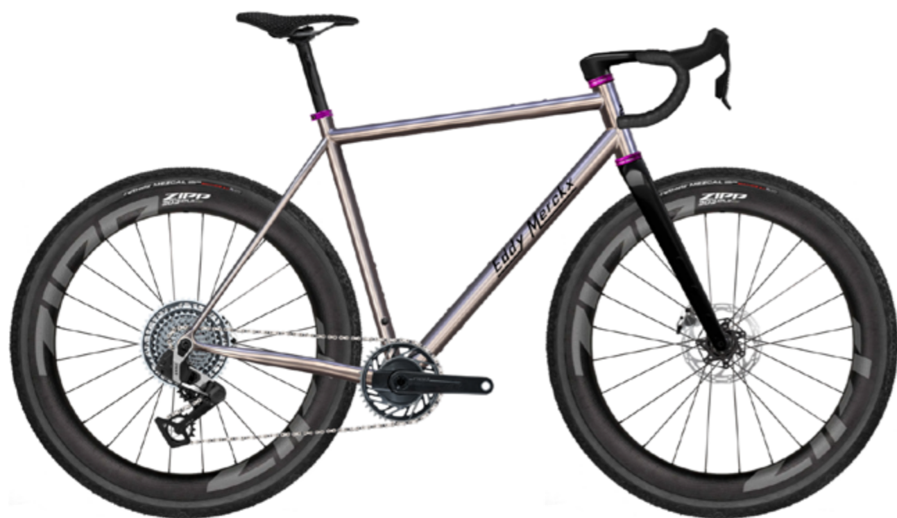
Corsa Strasbourg TI

un comportement plus vif trouveront dans le Strasbourg A (alu) le modèle le plus agile – l'aluminium étant plus rigide que l'acier et plus léger, il procure une sensation de conduite plus directe. Les trois versions portent le nom légendaire d'Eddy Merckx et allient charme rétro et technologie moderne (freins à disque, axes traversants, transmissions contemporaines, etc.). Côté prix, le Strasbourg A débute à environ 1'999 CHF, la version acier également dès 1'999 CHF , tandis que le modèle carbone est proposé à partir d'environ 3'499 CHF selon l'équipement. Sur demande, les vélos Merckx sont entièrement configurables – fidèle à l'esprit héritage de la marque, qui propose même des cadres en titane . Pour les amateurs d'esthétique classique du cyclisme de course qui ne veulent pas renoncer au confort sur les pistes gravel, le Strasbourg représente ainsi un juste milieu doré.