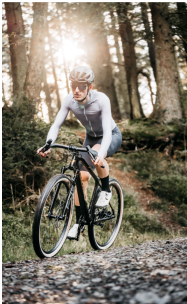
Ignite GTX en Black