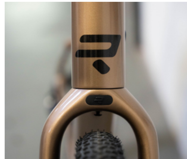
Kanzo Adventure en Desert Dune Metallic