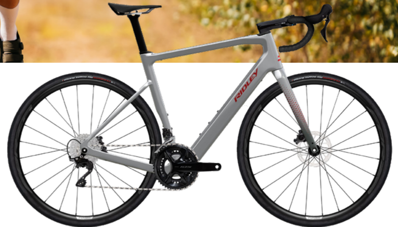
Ridley E-Grifn in Battle Ship Grey

Drehmoment und 200 W Spitzenleistung , setzt gezielt ein und ist oberhalb von 25 km/h kaum wahrnehmbar. Die Rahmengeometrie bleibt identisch mit dem ASTR RS: steifer Sitzwinkel (74°), direkter Lenkwinkel (71,5°), sowie grosszügige 52 mm Reifenfreiheit für Komfort und Tempo gleichermaßen. Die ersten Komplettbauten starten bei etwa 7'599 CHF (Apex AXS) und reichen bis 8'599 CHF.