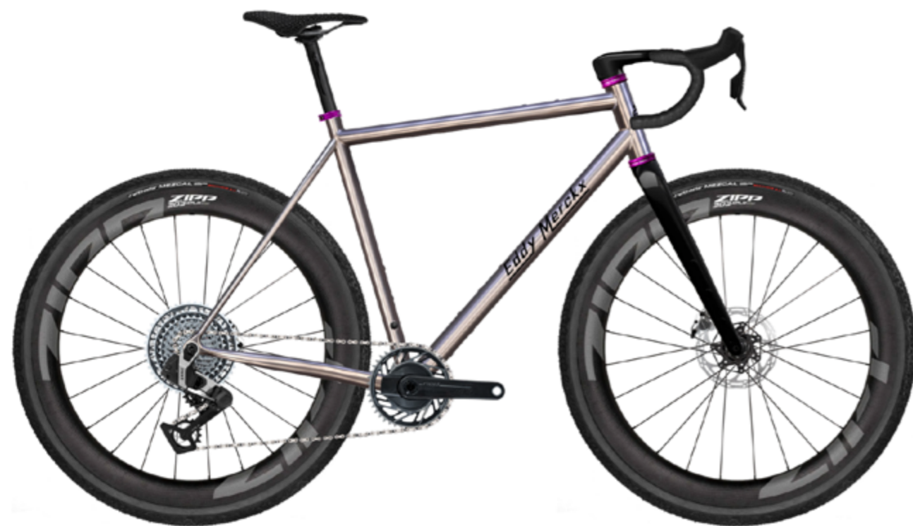
Corsa Strasbourg TI

barbarischsten Strassen» suchen. Wer ein spritziges Handling bevorzugt, findet im Strasbourg A (Alu) den agilsten Vertreter – Aluminium ist steifer als Stahl und leichter, was in direkterem Fahrgefühl resultiert. Alle drei Versionen tragen den legendären Namen Eddy Merckx und verbinden Retro-Charme mit aktueller Technik (Scheibenbremsen, Steckachsen, moderne Schaltungen etc.). Preislich startet das Strasbourg A bei etwa 1'999 CHF , Stahl ebenfalls ab 1'999 CHF , während das Carbon-Modell je nach Ausstattung ab rund 3'499 CHF erhältlich ist. Auf Wunsch sind die Merckx-Räder vollständig konfigurierbar – ganz im Sinne der Heritage-Marke, die sogar Titanrahmen im Programm hat. Für Liebhaber klassischer Rennsport-Ästhetik, die auf Gravel-Pisten nicht auf Komfort verzichten wollen, bietet das Strasbourg damit einen goldenen Mittelweg.