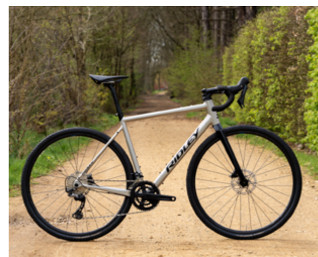
Grifn A in Chain Silver Grey