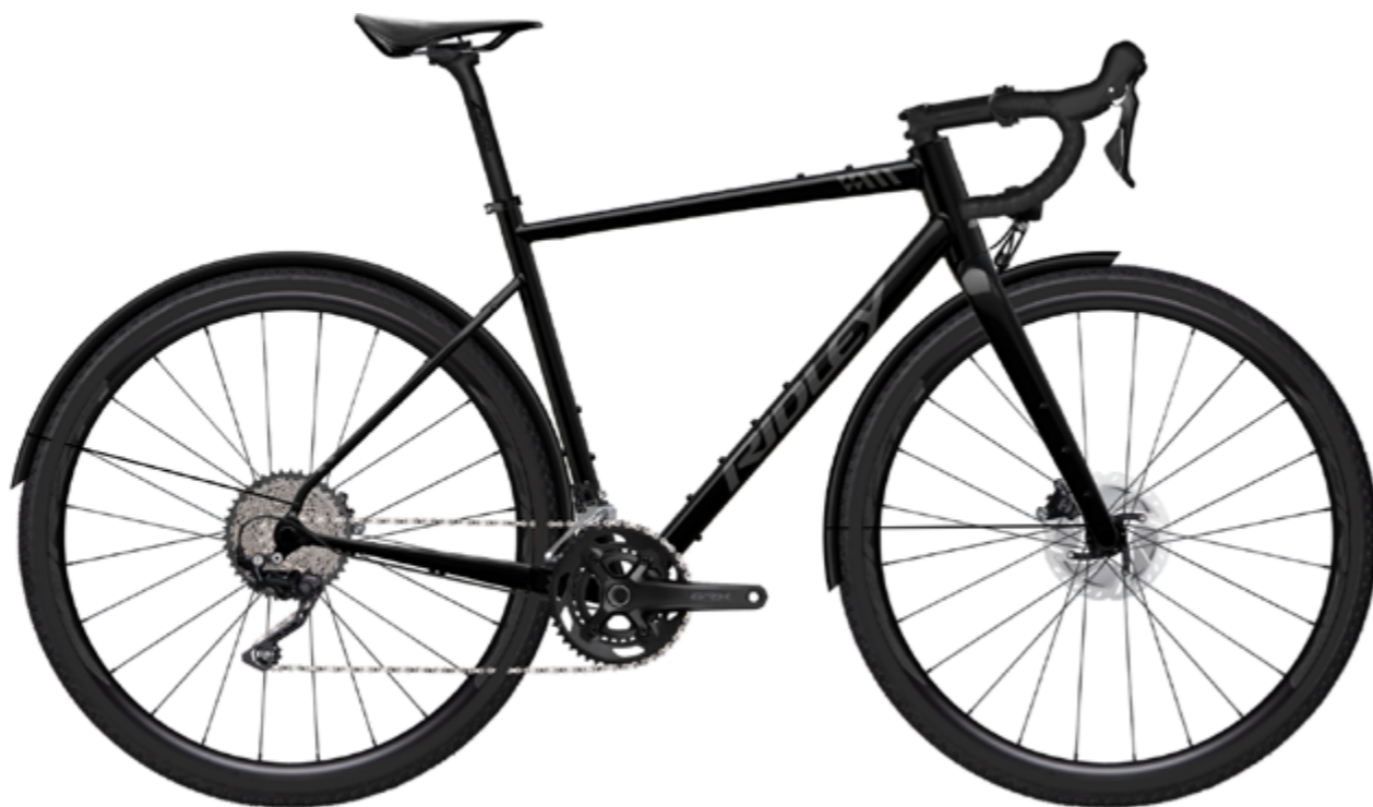
Kanzo Adventure A EQ in Black

Mit dem neuen Kanzo Adventure A EQ erweitert Ridley das Adventure-Segment um eine voll ausgestattete Variante für Pendler:innen und Tourenfahrer:innen. Auf Basis der bewährten Geometrie des Kanzo Adventure A bietet die EQ-Version praxisorientierte Details wie integrierte Lichtanlage mit Nabendynamo, Curana-Schutzbleche und reflektierende Decals für maximale Sichtbarkeit im Strassenverkehr. Die robusten Schwalbe Overland Reifen mit Reflexstreifen und das DT Swiss G1800 Laufradset mit Dynamo-Nabe machen das EQ zu einer wartungsarmen, alltagstauglichen Lösung – ideal für Fahrer:innen, die ein komplettes «Ready-to-Ride»-Gravelbike möchten, das Komfort, Funktion und Stil vereint für einen sehr vernünftigen Preis: 2'499 CHF.