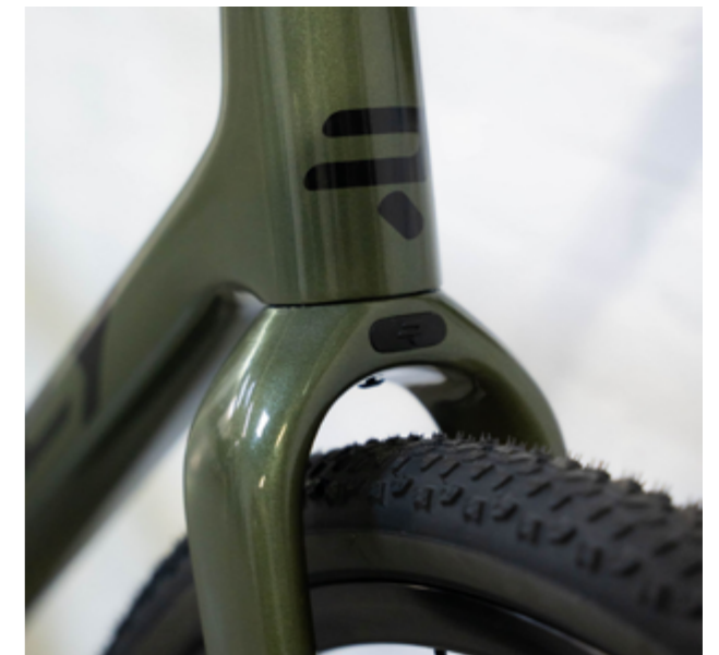
Kanzo Adventure in Army Green Metallic