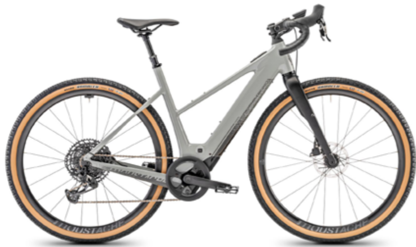
Dimanche 29 Gravel Open in pebble grey glossy