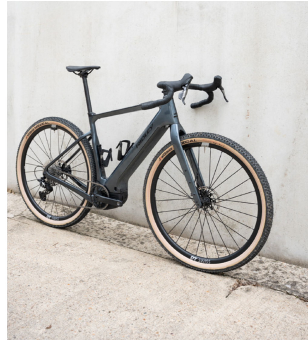
E-Kanzo Adventure in Pearl Silver