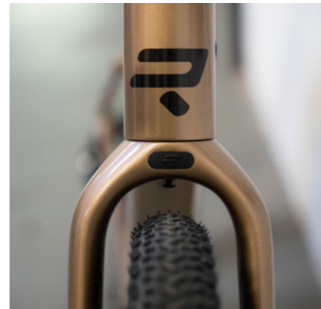
Kanzo Adventure in Desert Dune Metallic