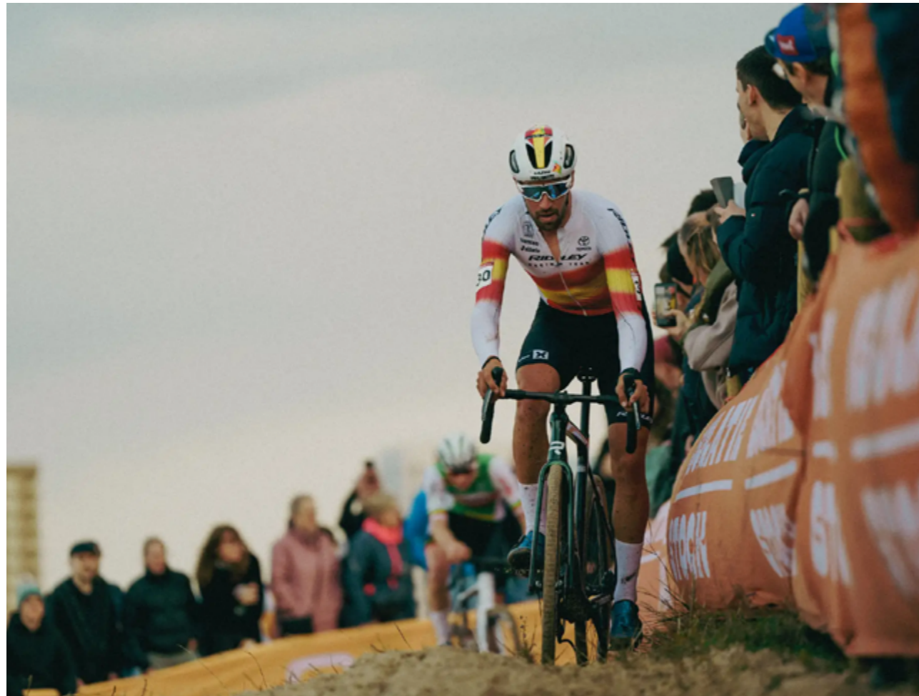
X-Night in Ridley Team Design