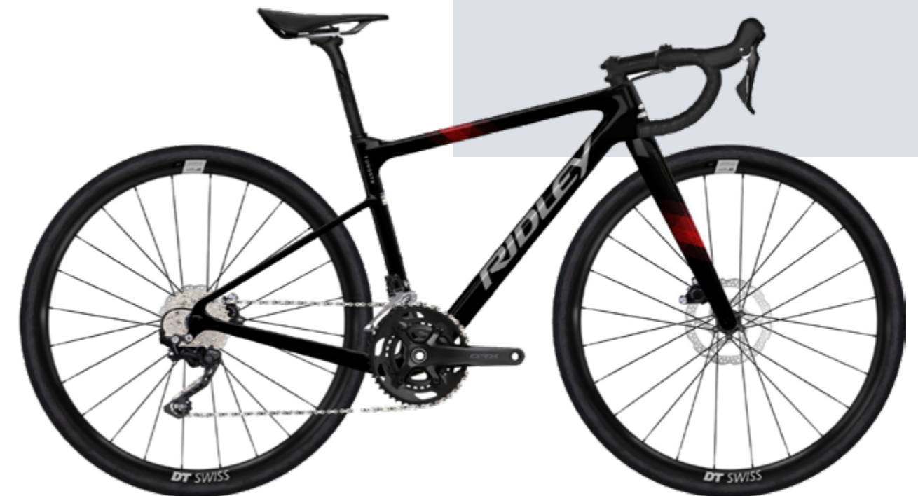
YUNGSTR in Black Silver Red Glossy

stand – sehr laufruhig bergab, aber noch behänd genug für Serpentinien. Ridley verbaut sogar sein bewährtes Flex-Stay Hinterbau-Design, um Vibrationen trotz starrem Rahmen zu filtern. Das Ignite GTX ist entweder mit Carbon-Starrgabel oder mit der 100 mm-Federgabel erhältlich (der Rahmen ist für beide Varianten ausgelegt). Vier verschiedene Ausstattungen – alle mit 1x12-Antrieb – decken das Spektrum ab: Los geht es z. B. mit SRAM Rival und Starrgabel für 2'999 CHF, mit Federgabel und Sram Apex ebenfalls ab 2'999 CHF (Judy Silver) und bis CHF 3'800 für höherwertige Builds (SRAM Rival 1 oder Rival GX AXS Mullet). Kurz gesagt, das Ignite GTX ist das Grenzgänger-Bike für alle, die den ultimativen Dropbar-Offroad-Kick suchen. So radikal wie es ist, bleibt es doch ein spannendes Konzept – «das nächste Kapitel der Gravel-Evolution» so die Aussage von Bikerumor.