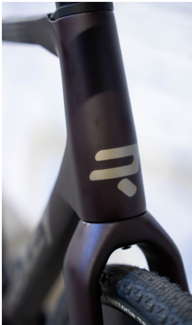
Grifn in Dark Plum Metallic