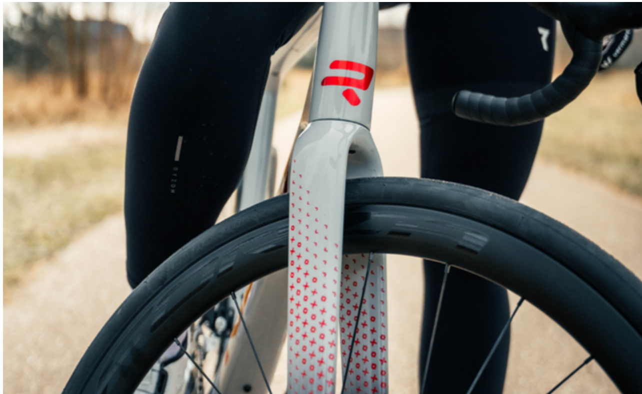
Grifn RS in Battle Ship Grey