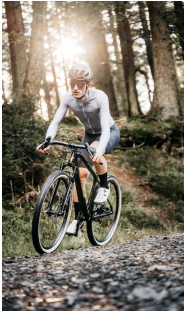
Ignite GTX in Black