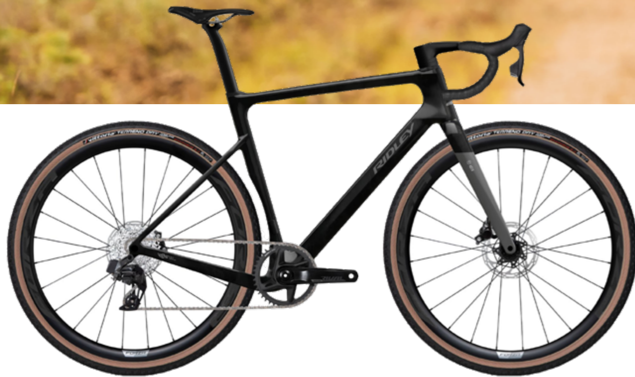
Ridley E-ASTR in Dove Grey