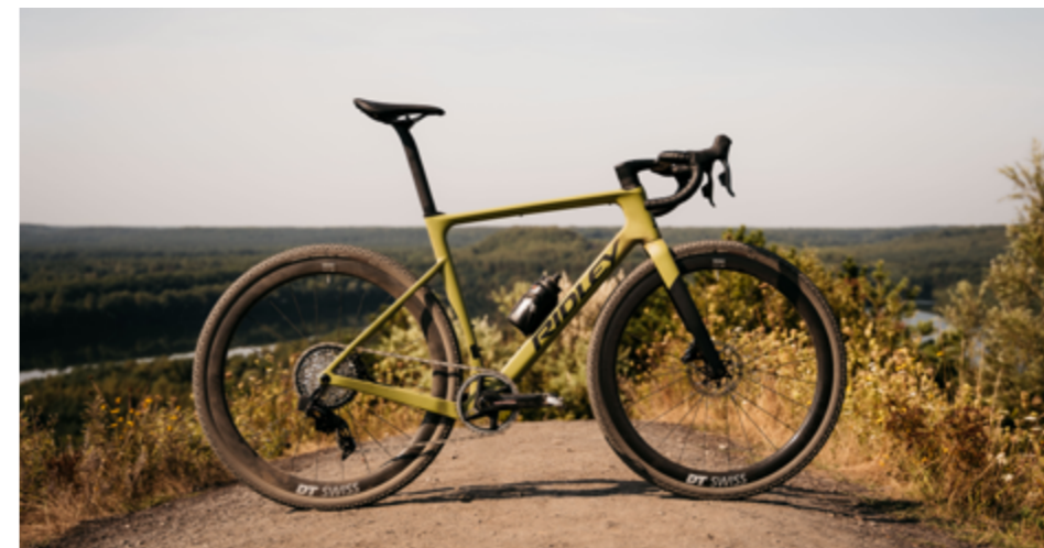
ASTR in Rich Orange Metallic und ASTR RS in Crocodile Green