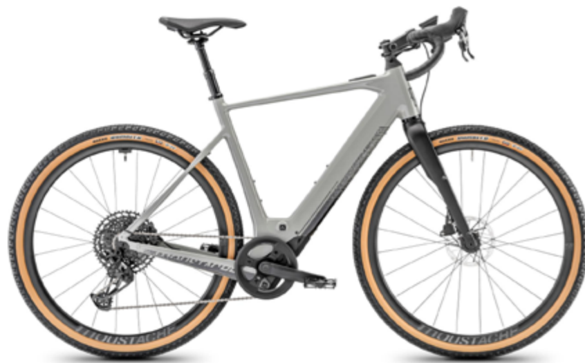
Dimanche 29 Gravel in pebble grey glossy